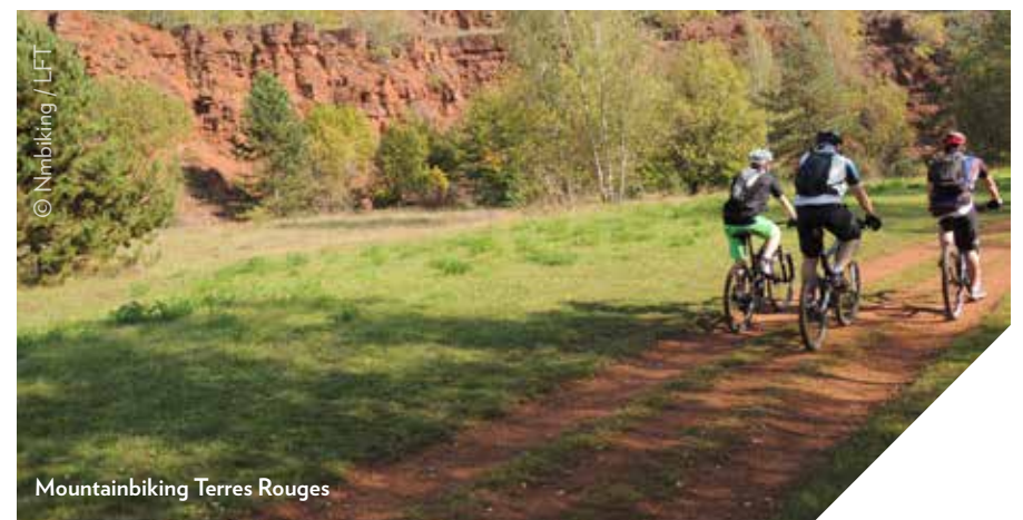
Mountainbiking Terres Rouges