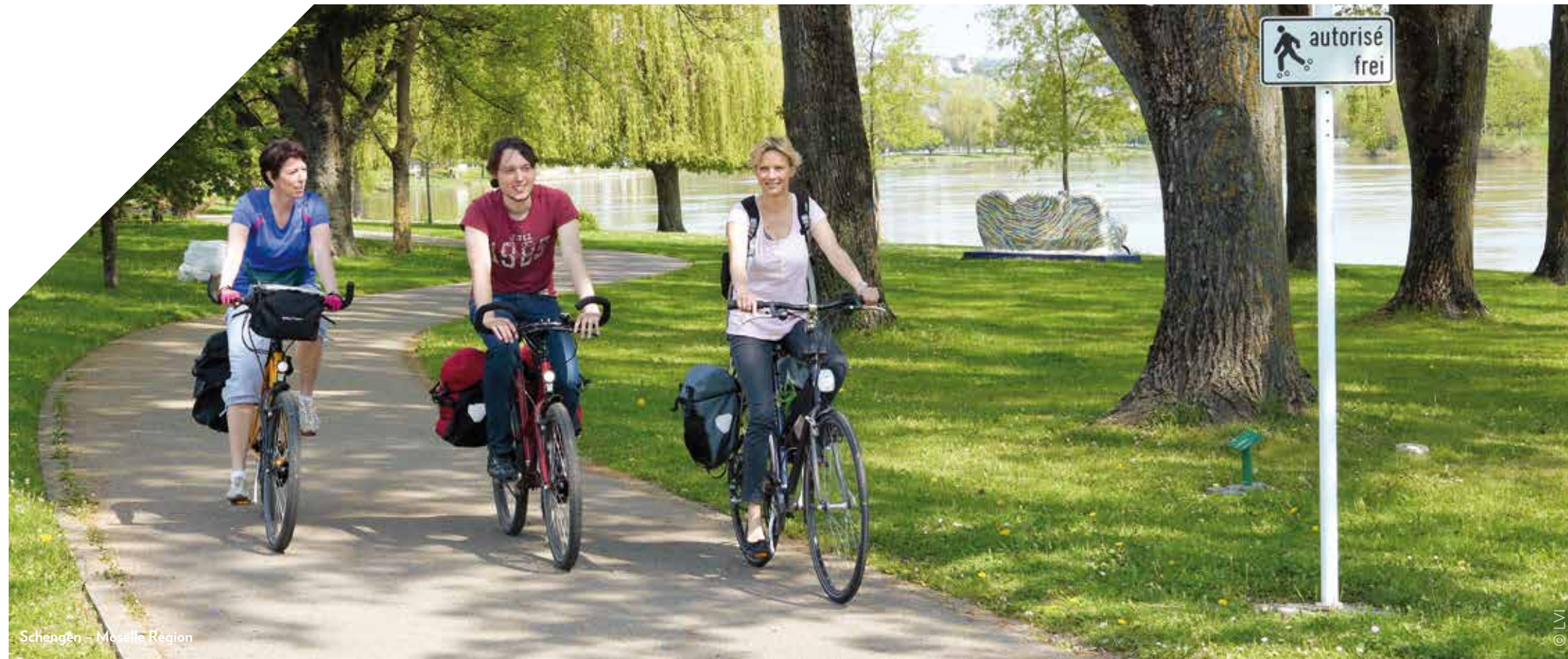
Schengen – Moselle Region

À CHACUN SON TERRAIN! | JEDEM SEINE STRECKE! | IEDER ZIJN TERREIN!