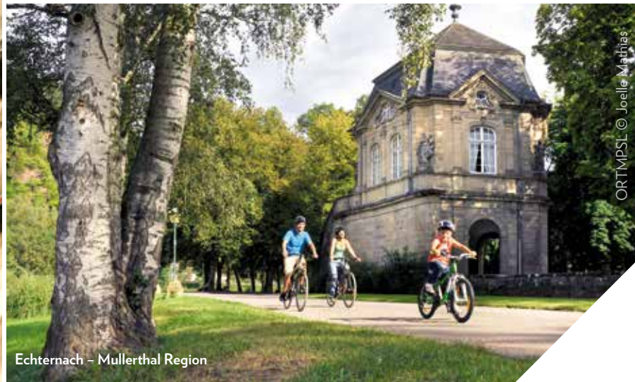
Echternach - Mullerthal Region