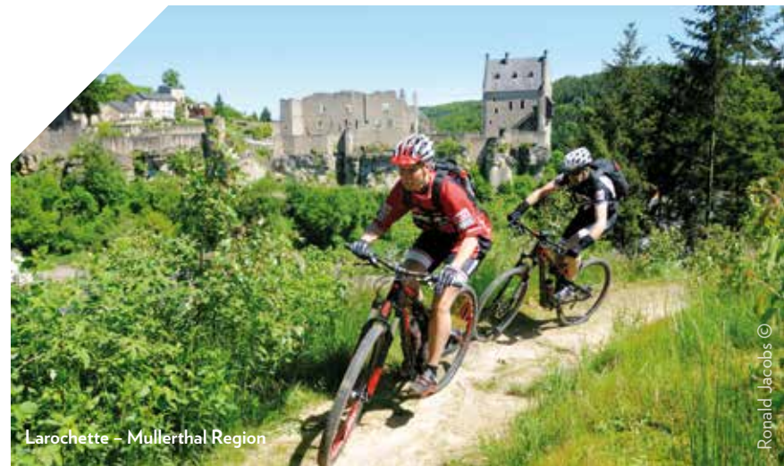
Larochette - Mullerthal Region

If you are an occasional rider, there are all sorts of places where you can rent mountain bikes and equipment. You can also ask for advice and inquire about the difficulty level of the routes.