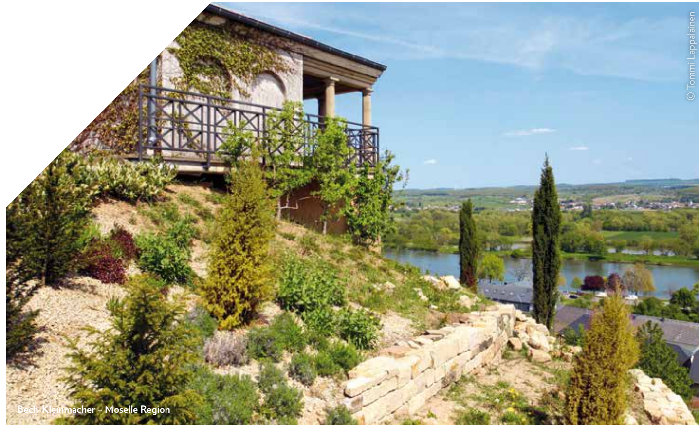
Bach-Kleinmacher – Moselle Region

À CHACUN SON TERRAIN! | JEDEM SEINE STRECKE! | IEDER ZIJN TERREIN!