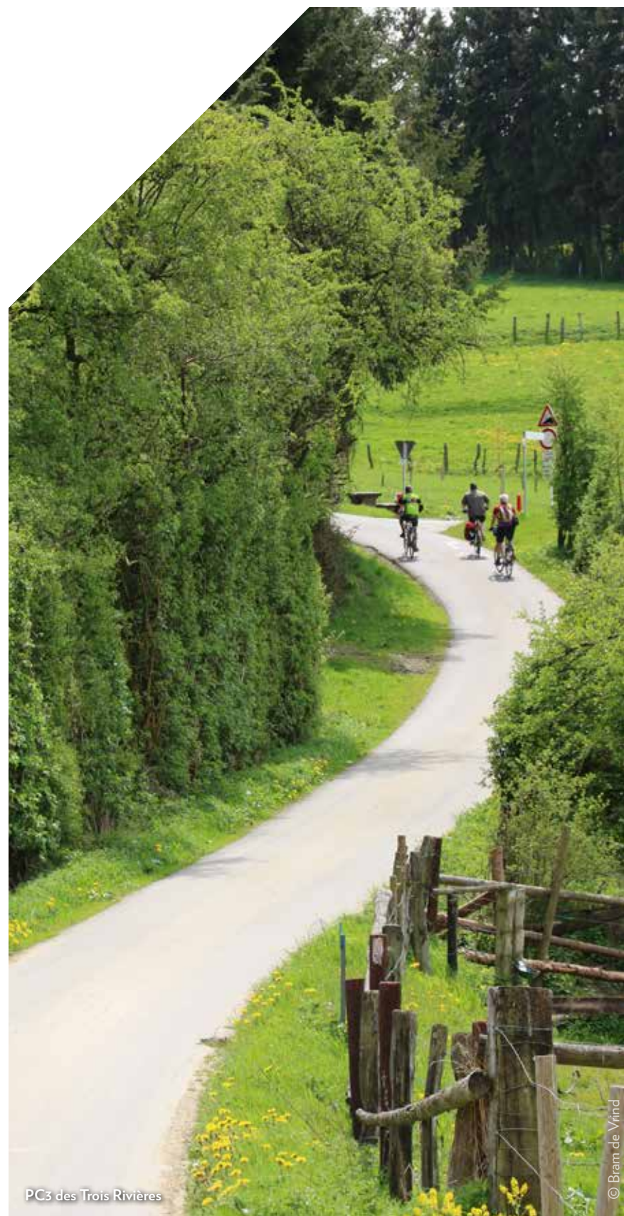
PC3 des Trois Rivières