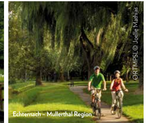
Echternach – Mullerthal Region

Die Tour verläuft teilweise über den nationalen Radweg PC12, welcher diese mit der Wisen West Tour verbindet. Sie werden über kleine, hügelige Straßen und Wege geleitet, von wo aus sich dem Radfahrer herrliche Aussichten bieten.